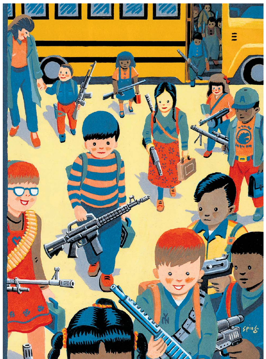
illustraties uit: 'Kus uit New York'

Spiegelman verkent de grenzen van wat kan en mag. Hij beledigt met een doel. De chassidische jood en de zwarte vrouw die elkaar kussen zijn voor hem in de eerste plaats een welgemeende illustratie van het Valentijns-thema 'All you need is love'. Maar het venijn zat hem natuurlijk in de tweede betekenis: zijn bijtende verwijzing naar de segregatie in New York. Juist in 1991 waren er in Crown Heights in Brooklyn rellen geweest tussen zwarte en joodse New Yorkers. „Ik had het gevonden: een beeld dat op een omslag aantrekkelijk en uitnodigend was, en tegelijkertijd grensverleggend en onbehaaglijk!” zegt Spiegelman in Kus uit New York ,